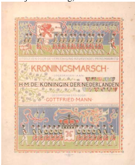
Titelblad van de “Kroningsmarsch” uit 1898. Gecomponeerd ter gelegenheid van de inhuldiging van Koningin Wilhelmina